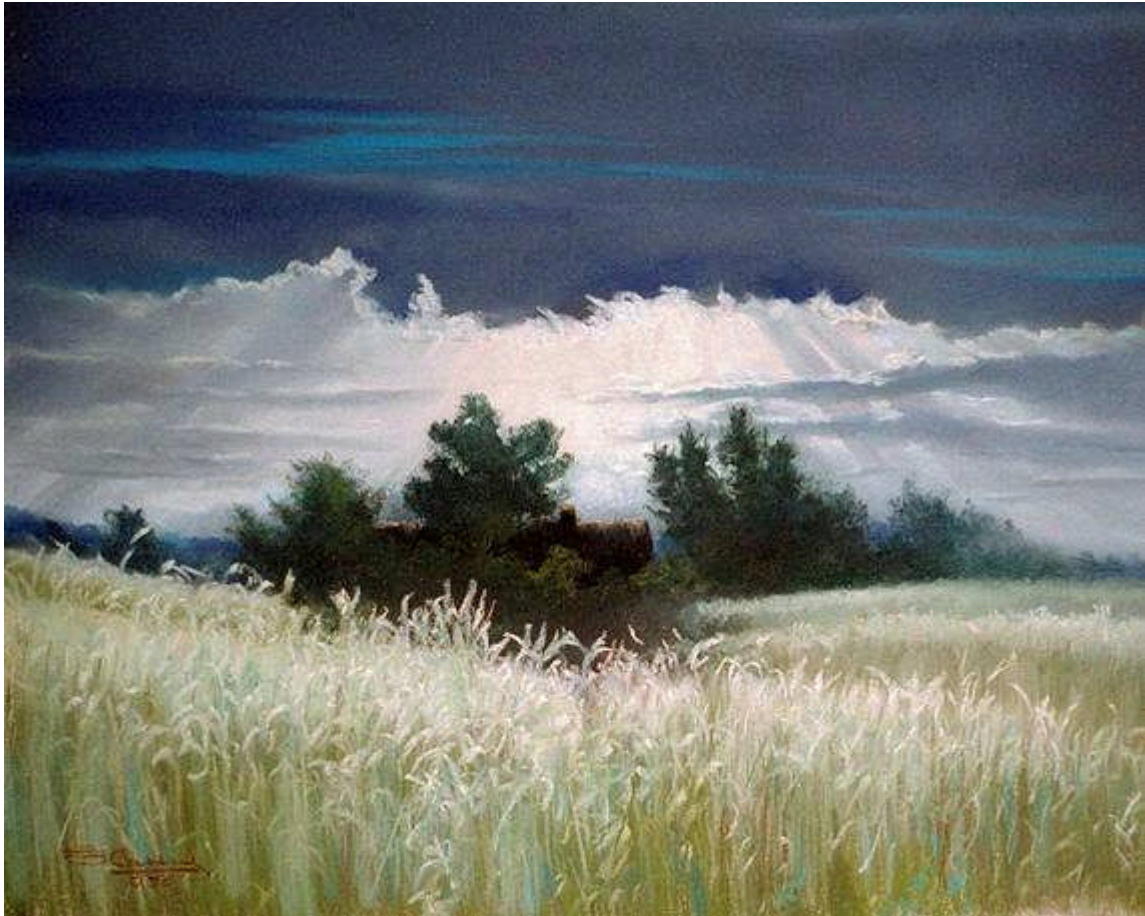
Everberg. L'éventail. Pastel. 1950.